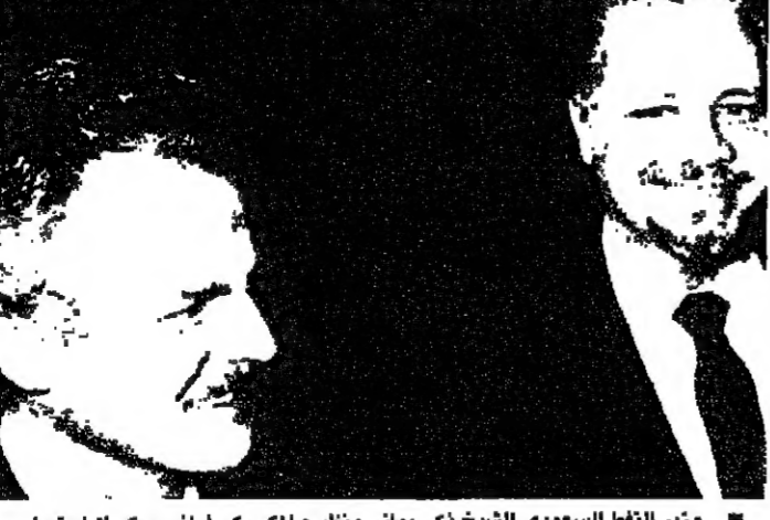
وزير النفط السعودي الشيخ نعي بنعني ونظيره المكسيكي فرانسيسكو لاجاستيدا بعد الاجتماعات

جنتف - وافي رمضان: ١٨٢ صحافياً اجتمعوا في مؤتمر وزراء نفط دول منظمة أوبيك الذي كان يومه الثاني أكثر شياً بوضوح المنظمة ككل. أو بمعنى آخر كان اليوم الثاني مليئاً بالمحادثات الجانبية والاجتماعات مع وسائل الإعلام. ولم يظهر في بيانها والتسامح اسبحاً كما كان في المضي من ميزات هذه المنظمة. المصالحون الإتحاديون سيهونون على مساعدة لكتبات السوق لا متباعدة كاتل هيبه الأوبيك، ويبدوون بوجودهم شديد تفككها الذي تحلم به دول المنظمة النفطية. اليوم الأول لمؤتمر أوبيك الطارئة تميز بخروج وزير نفط دولة الامارات العربية المتحدة الدكتور مناح سعيد العميرة بعد غيابها عن اجتماعات أوبيك، وحين تمكّن مستشرق جمع صور الامارات لانها تعبير رمزي عن الضعف والعجز. استطرد شيراك قائلا: ان كل شيء يلزمنا بتوحيد جهودنا البيولوجية وأعرى شيراك عن العمل في أن تتجيز وزارة الأمير عبد الله لغرضها للدولتين أن تتعامل معاً بصورة أوثق. مساعدة لجان وتحدث الأمير عبد الله في نفس (البقية على الصفحة ٨)